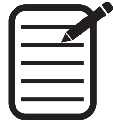
llenar la encuesta de salud