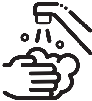
lavarse las manos